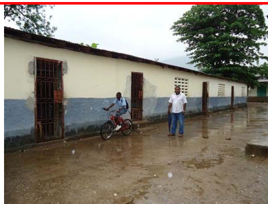
Se estructura en dos zonas: la parte destinada a preescolar y primaria; y la reservada a secundaria y a la formación profesional, preparación muy necesaria en la zona pero que debido a un robo se ha cerrado temporalmente.