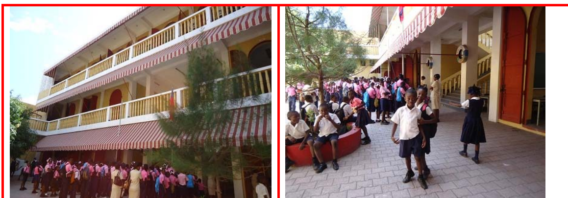
Imágenes del centro.

Está situada en la ciudad de Les Cayes. Se compone de dos grandes edificios contrapuestos. Uno es el colegio de primaria y el otro dedicado a la formación profesional y la residencia de las hermanas. El colegio tiene un total de 656 alumnos.