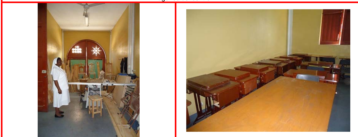
La clase de ebanistería (izq.) está en un pasillo estrecho y sin luz. Lo mismo ocurre con el resto de clases, como la de costura (drch.), las cuales son pequeñas y poco iluminadas.