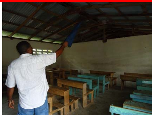
Las clases son oscuras, tienen goteras y el mobiliario es bastante viejo e insuficiente.