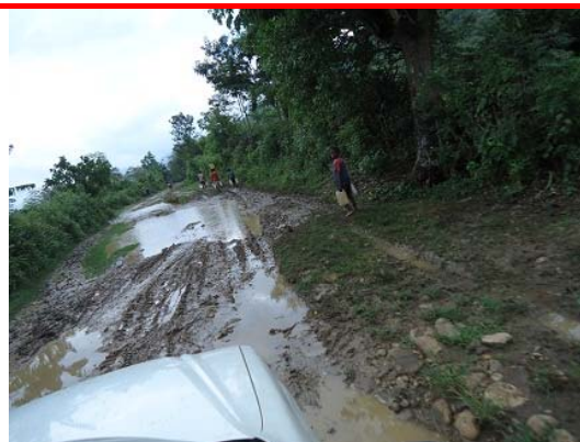
Cauce del río que los alumnos tienen que cruzar diariamente para ir a la escuela (izq.) y estado de las vías de acceso al centro