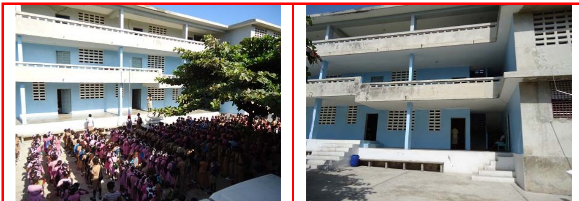
Imágenes externas de la Escuela

Está situada en el barrio que da nombre a la escuela, en la zona de Carrefour, una de las más peligrosas de la capital. Se encargan desde 1978 de dar la educación fundamental (seis cursos) a los niños más pobres. Actualmente tienen 575 alumnos.